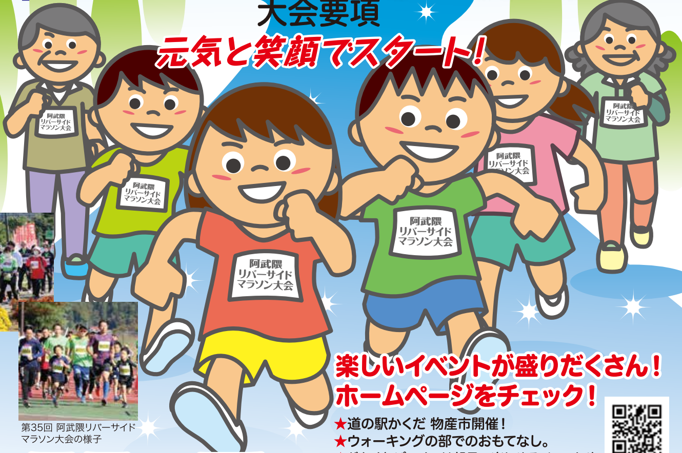
第35回 阿武隈リバーサイドマラソン大会の様子